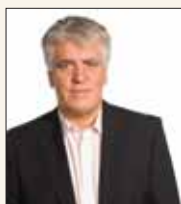
Βασίλης Ζορμπάς Δήμαρχος

"Δήμαρχε είσαι αποκλειστικά υπεύθυνος αν ο φίλος σου υφαρπάξει το Εθνικό Κληροδότημα "Σιστοβάρη"